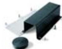
Крепление стрелы круглого сечения G0402 001 G0405