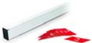
Светоотражающие наклейки 24 шт. 001 G0461 Алюминиевая стрела 60x40x2700 001 G0251