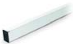
Алюминиевая стрела 60x40x4200 001 G0401