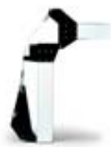
Шарнир для складывания стрелы 001 G0257