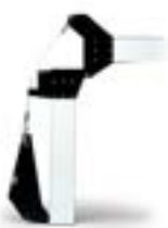
Шарнир для складывания стрелы 001 G0467