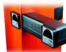
Кронштейн крепления фотоэлемента DOC 001 G0468