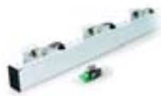
Сигнальные лампы 6 шт. 24В на стрелу G0401 001 G0460