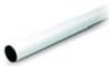
Алюминиевая стрела круглого сечения 60x4200 001 G0402