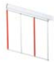
Шторка под стрелу G0401-G0402 длиной 2 м 001 G0465