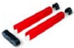
Резиновые накладки на стрелу G0401 001 G0403